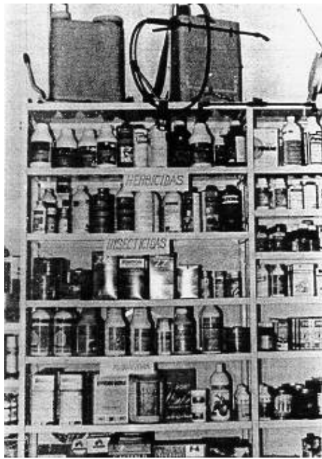
Fig. 1: Almacén de pesticidas

En el etiquetado de los recipientes que contengan pesticidas debe respetarse lo indicado en el Reglamento sobre declaración de sustancias nuevas y clasificación, envasado y etiquetado de sustancias peligrosas (RD 2216/85). En la NTP 137 se recogen los aspectos esenciales de dicho reglamento, indicándose también los pictogramas que deben incluirse en las etiquetas.